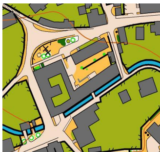
MSR štafiet v šprinte