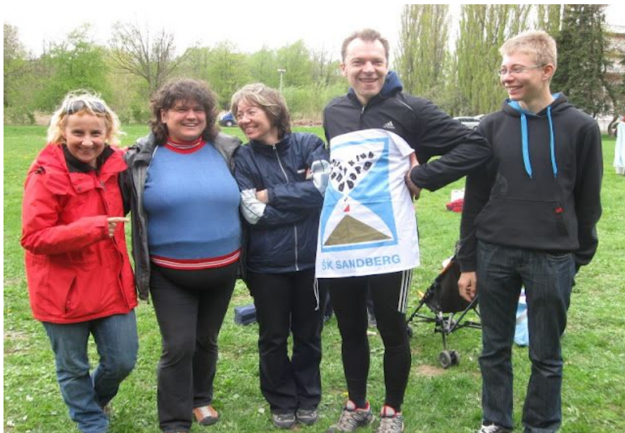
Takto sme sa tešili z výsledkov na Pohári jarného blata