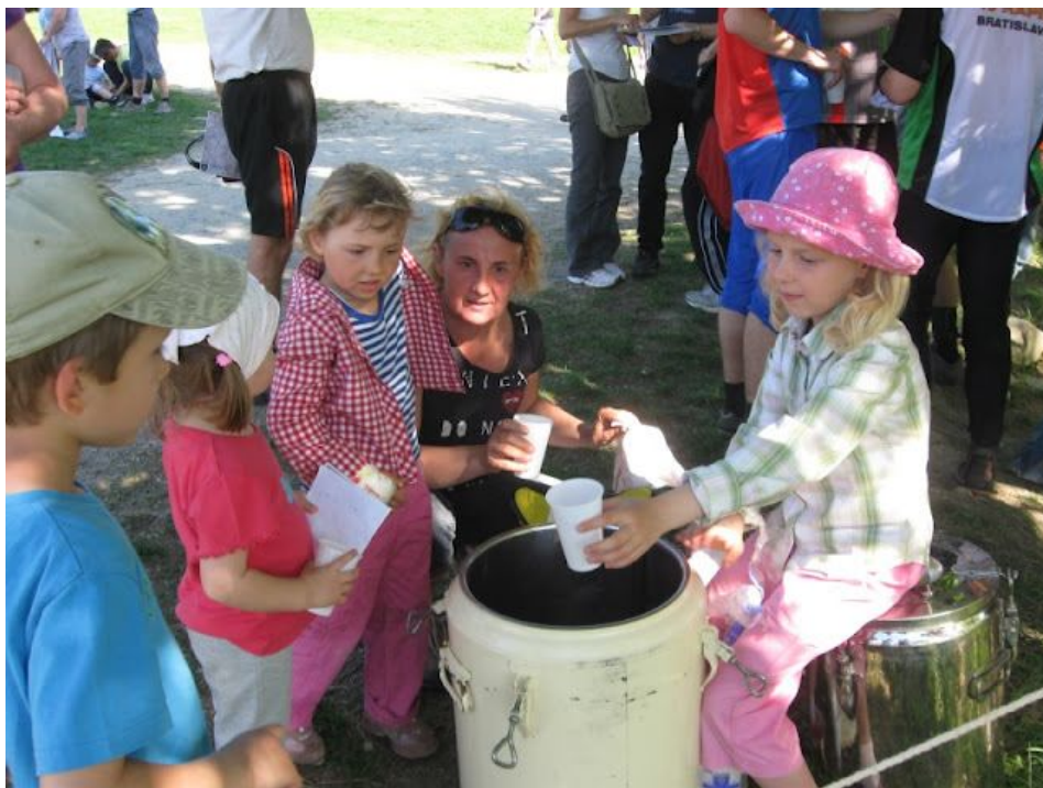
V slnečnom a teplom počasí na lúke dobre padlo občerstvenie.