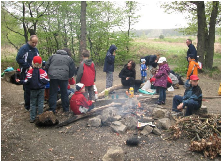
Prvý spoločný tréning ŠK Sandberg sme zakončili opekačkou.

V nedeľu 15. apríla sme sa stretli na lúke Kukuričák nad Dlhými dielmi a spoločne sme si zatrénováli. Zišlo sa nás tam naozaj dosť, prišli aj deti z krúžku OB na ZŠ Odborárska a ďalší hostia. Vyskúšali sme si trať T-2 nadchádzajúcich pretekov Spoznaj les..., a zároveň sme vyskúšali elektronickú časomieru. Počasie síce nebolo najpriaznivejšie, ale všetko napokon dopadlo dobre. Časomiera funguje, trať bola síce náročná, ale na preteky ju staviteľ trochu zjednoduší. Zabehli si všetci a tak dobre padli čerstvo opečené špekáčky či slaninka s cibou- .