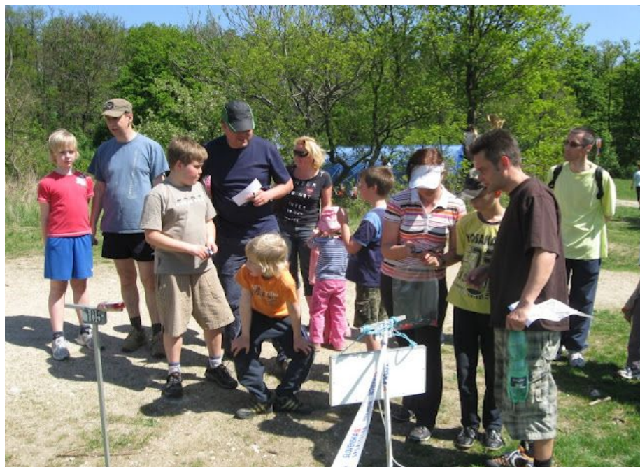
Ukážka trate T-3 (J. Horniak)

(pokračovanie z predošlej strany) papierových preukazoch, vyvešovanie výsledkov, detský pretek, príprava cien a ocenenie. Nakoniec aj balenie všetkých vecí a rýchle spracovanie výsledkov. Počasie tiež prialo (to sme vybavovali hodne dopredu) a takisto ďakujem aj všetkým, ktorí ešte popri pomoci išli aj behať. Som rád, že sme sa k organizácii postavili zodpovedne a nebolo treba riešiť väčšie problémy." Tešíme sa na stretnutie o rok. Druhé klubové preteky – Jelení paroh-- nás čakajú na jeseň.